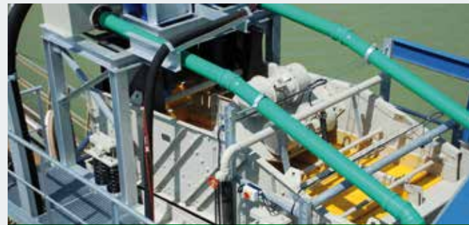
STICHWEH-ENTWÄSSERUNGSSIEBMASCHINE EB 18/35 mit 2 Siebbahnen und Zyklon