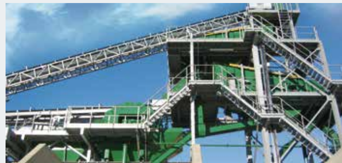
STICHWEH-Aufbereitungsanlage mit ZWEIDECKSIEBMASCHINE VS 18/50 ZWEIDECKSIEBMASCHINE VS 21/60 Schöpfrad E 4009 LA Entwässerungssieb Eb 12/35-03