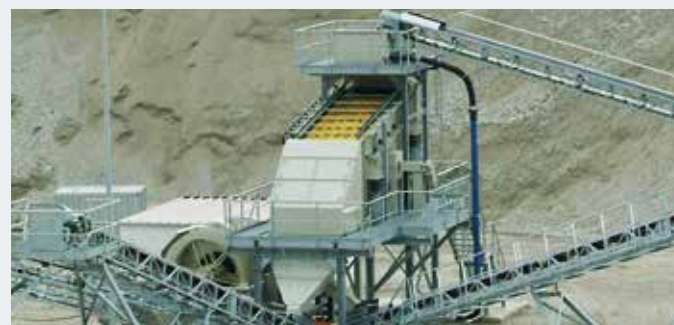
STICHWEH-Aufbereitungsanlage mit EINDECKSIEBMASCHINE VS 15/40 DREIDECKSIEBMASCHINE VS 18/60 Schöpfrad ES 3009 BB

ODER INFORMIEREN SIE SICH UNTER smt-stichweh.com