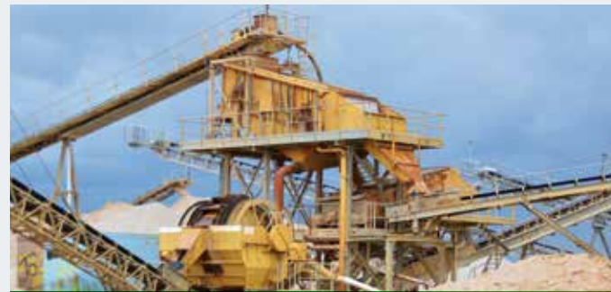
STICHWEH-Aufbereitungsanlage mit ZWEIDECKSIEBMASCHINE VS 24/60 Doppelwellenschwertwäsche DSW 150/2100/6000 Schöpfrad ES 3509 BB