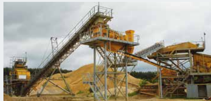
STICHWEH-Aufbereitungsanlage mit EINDECKSIEBMASCHINE VS 15/40 ZWEIDECKSIEBMASCHINE VS 24/60 DREIDECKSIEBMASCHINE VS 15/50 Doppelwellenschwertwäsche DSW 120/2100/6000 Entwässerungssieb Eb 09-25-1